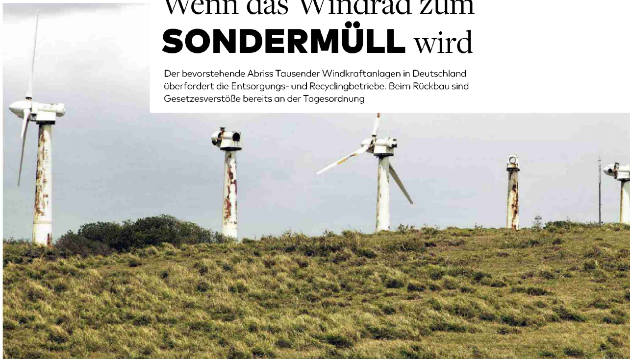
Außer Betrieb: Windmühlen auf Hawaii. In Deutschland erreichen auch viele Anlagen ihr Nutzungsende und müssen entsorgt werden

Der bevorstehende Abriss Tausender Windkraftanlagen in Deutschland überfordert die Entsorgungs- und Recyclingbetriebe. Beim Rückbau sind Gesetzesverstöße bereits an der Tagesordnung