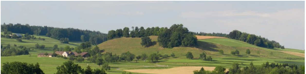
Geländekuppe bei Hombärg (links: Guggebüel).