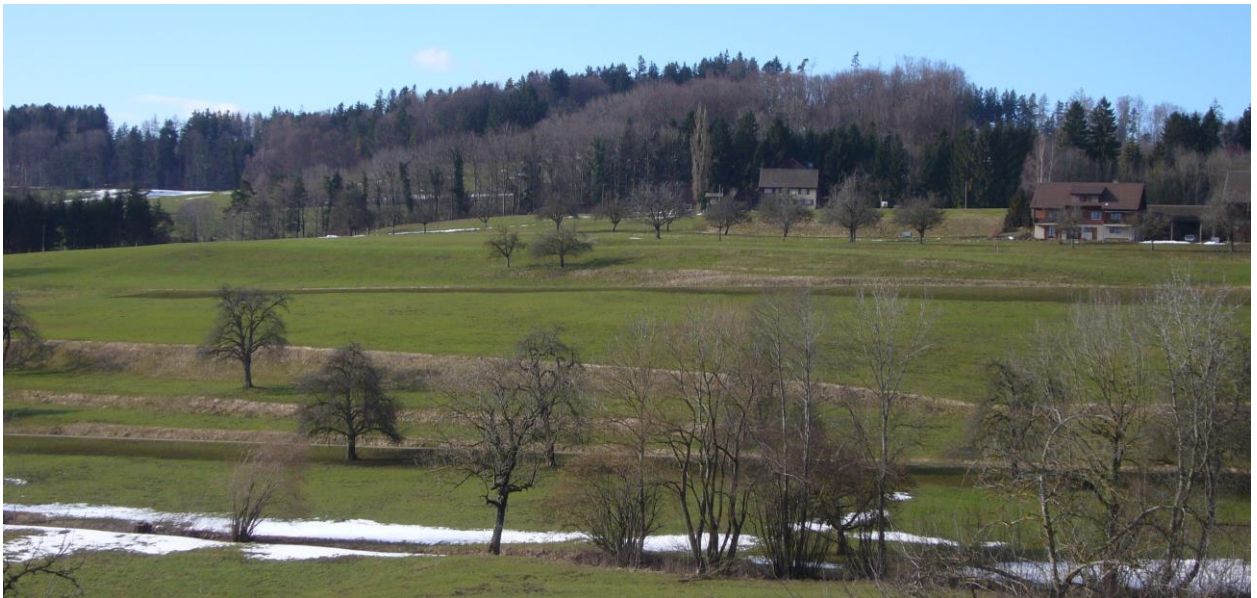
Ackerterrassen oberhalb von Lustdorf.