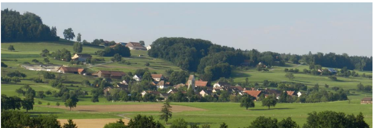
Lustdorf (von Bönler aus).