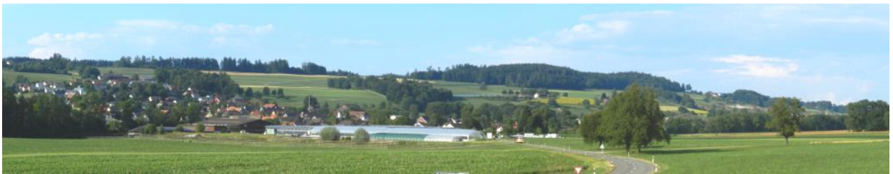
Östliche Südflanke des Gebietes mit Thundorf bis Hessenbool / Lustdorf (von südlich von Thundorf aus).