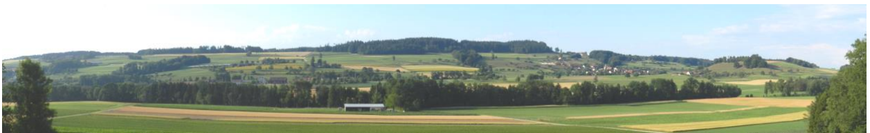
Östliche Südflanke des Gebietes zwischen Thundorf und markanter Geländekuppe bei Hombärg. Lustdorf rechts von der Mitte (von Bönler aus).