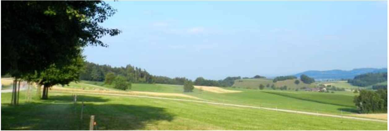
Blick von Fridbärg Richtung Osten mit ausgeprägter Geländekuppe bei Hombärg rechts der Mitte des Fotos.