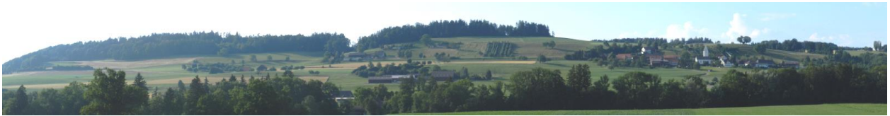
Westliche Südflanke des Gebietes mit Waldegg (links) und Tige / Kirchberg (rechts) von nördlich von Chöll aus.